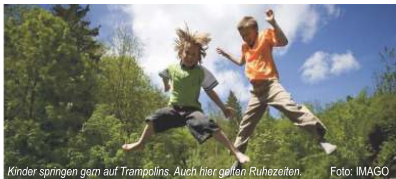
Kinder springen gern auf Trampolins. Auch hier gelten Ruhezeiten.

Auch bei Festen und Feiern im Garten gelten die Ruhezeiten. Werden diese nicht eingehalten, wendet man sich am besten an den Gartenvorstand.