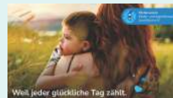
Weil jeder glückliche Tag zählt.