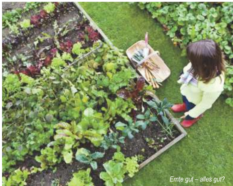
Ernte gut – alles gut?