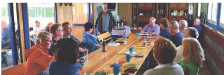
Zwischenstopp in der „Punika“-Vereinshalle.

Kreis-, Landes- und Bundespolitiker waren auch am 17. August 2023 in die KGA „Zur Erholung“ in Luckau gekommen und sparten nicht mit warmen Worten. „Es gibt doch nichts Schöneres, als eigenes Obst und Gemüse zu ernten“, sagte z.B. die Bundestagsabgeordnete Jana Schimke (CDU).