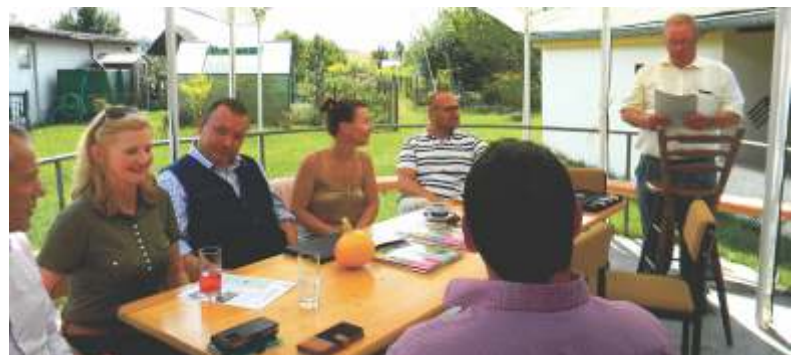
Informationsgespräch im Grünen

Wie Kleingärten aussehen sollten und wie nicht, das hat sie während eines Rundgangs durch die Kleingartenanlage gesehen. Gärten, die entsprechend der Rahmengartenordnung des Landesverbands Brandenburg der Gartenfreunde bewirtschaftet werden, liegen neben Gärten, die vor sich hin wildern. Dabei ist eine gärtnerische Nutzung dringend vorgeschrieben. Auf mindestens einem Drittel der Fläche sind Obst und Gemüse anzubauen.