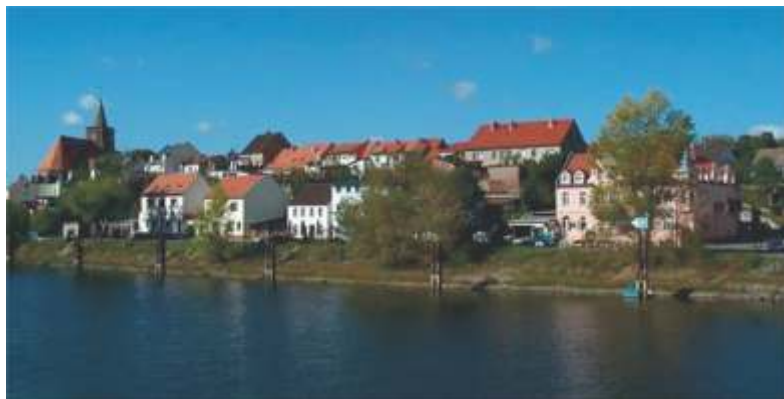
Fürstenberg – die Wiege der Stadt an der Oder.

EISENHÜTTENSTADT. Die Stadt nimmt unter allen Städten Ostdeutschlands eine Sonderstellung ein, denn Eisenhüttenstadt wurde als „erste sozialistische Stadt auf deutschem Boden“ am Reißbrett konzipiert und auf der „Grünen Wiese“ errichtet, zwischen der über 750 Jahre alten Stadt Fürstenberg/Oder und den Dörfern Schönfließ und Diehlo.