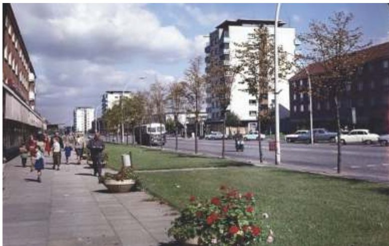
Die City von „Hütte“.

Über die Geschichte der Stadt, die im Übrigen bis 1961 „Stalinstadt“ hieß, informiert das Städtische Museum mit seiner Galerie, die über eine kulturhistorische bedeutsame Kunstsammlung verfügt. Den DDR-Alltag zu erforschen und in wechselnden Ausstellungen darzustellen, ist Ziel des