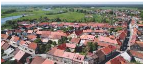
Unser Foto: Vom Burgturm in Lenzen aus kann man einen Rundumblick genießen: Wiesen und Wälder, die Löcknitz, die Elbe und der Rudower See.

Unter dem Motto „alt | stadt | grün“ hatte die AG „Städte