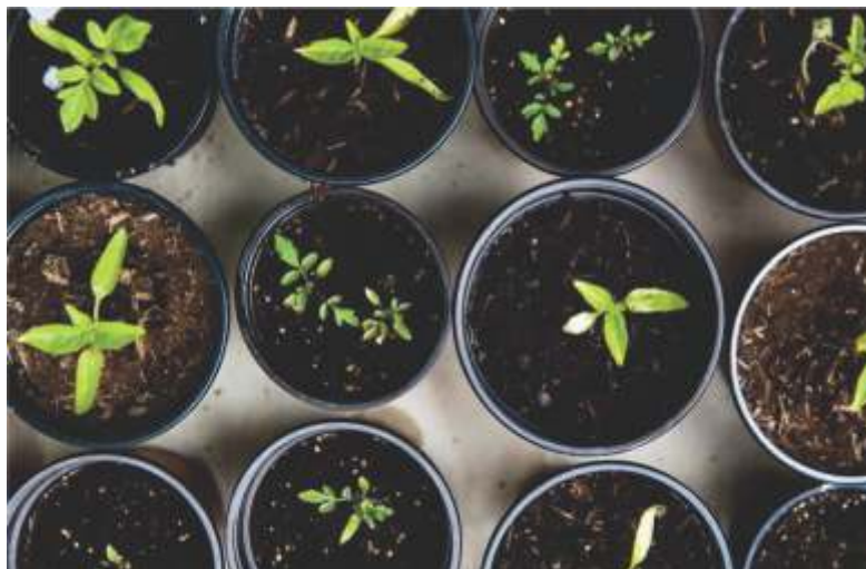
Setzlinge können ganz wunderbar in der Wohnung oder in einem kleinen Gewächshaus, auf dem Balkon oder der Terrasse, vorgezogen werden.

Bestimmte Sorten – und Unkraut – breiten sich schneller aus, als es den meisten Gartenbesitzern recht ist. Daher sollten Liebhaber von Himbeersträuchern oder Minzpflanzen genau beobachten, welche neuen Gebiete die vermehrungsfreudigen Pflanzen zwischenzeitlich erobert haben. Wer Himbeeren mag und lieber wenig Arbeit hat, erreicht sein Ziel durch Nichtstun. Nebenbei bemerkt, Giersch ist ein schnell wachsendes Unkraut, schmeckt aber zugleich lecker im Salat.