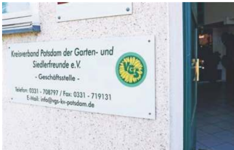
Das Türschild der Geschäftsstelle des VGS. Hier lebt es sich wohl „gut“!?

Wir erinnern weiter: In der Landeshauptstadt haben wir vor nunmehr 22 Jahren unsere „Märkische Gärtnerpost“ gegründet. Anlass war damals die BUGA 2001 in Potsdam. Und weil sich die Kleingärtner:innen immer mehr wehren mussten gegen auf Bauland gierige Mitbürger:innen. Bis dann 2017 der VGS unserer Zeitung gekündigt hat. Ohne Beschluss des Vorstandes und gar entgegen einem Beschluss der Mitgliederversammlung. Wen schert's?!