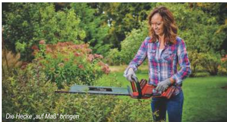
Die Hecke „auf Maß“ bringen

Vor dem Wintereinbruch gehört auch die Wartung der Kettensäge zu den wichtigen Pflegemaßnahmen, damit sie auch bei kalten Temperaturen und während der Aufbewahrung in der Winterzeit in einem guten Zustand bleibt. Sowohl die Kette als auch das Schwert sollten demontiert und mit Druckluft gereinigt werden. Baumharz und sonstiger Schmutz am Gehäuse lässt sich mit Waschbenzin einfach entfernen. Nach der Reinigung bietet es sich an, die bereits demontierte Sägekette zu schärfen und auf Beschädigungen hin zu untersuchen. Nach der Reinigung und Montage wird die Sägekette wieder eingefettet. Bei der Benzin-Kettensäge empfiehlt es sich, wie beim Rasenmäher, Tank und Vergaser zu leeren, Öl aufzufüllen und die Zündkerze zu überprüfen. Außerdem sollte der Luftfilter gereinigt, auf Verschleiß geprüft und falls nötig, ausgetauscht werden. Was für Kannen, Schläuche und Tonnen gilt, trifft im Winter umso mehr noch auf den Gartenteich und die dort eingesetzte Technik zu. Wer in seinem Garten zum Beispiel Pumpen für Teiche oder die Gartenbewässerung verwendet, muss diese über den Winter unbedingt außer Betrieb setzen. Das Wasser wird abgelassen, damit es in der Pumpe nicht gefriert und das Pumpengehäuse sprengt.