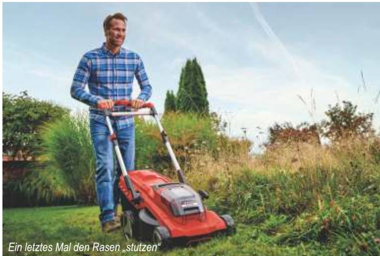
Ein letztes Mal den Rasen „stutzen“

Bei benzinbetriebenen Geräten gibt es wesentlich mehr Anforderungen: Hier sollte der Ölstand stimmen und wenn nötig ein Ölwechsel durchgeführt werden. Im Zuge dessen wird auch der Luftfilter geprüft und gereinigt. Ratsam ist auch, den Benzin-Tank vor der Winterpause restlos zu leeren.