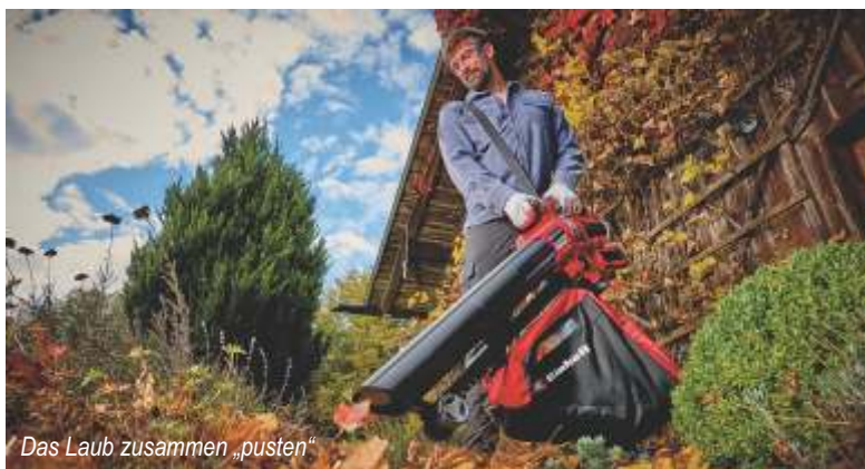
Das Laub zusammen „pusten“