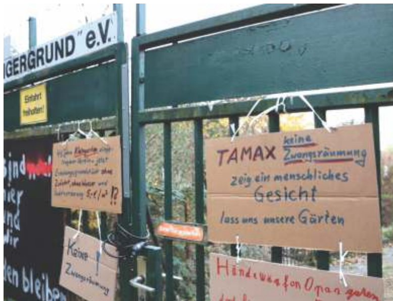
Diese „Türschilder“ zierten vor ein paar Jahren den „Angergrund“. Sechs Parzellen sind übrig...